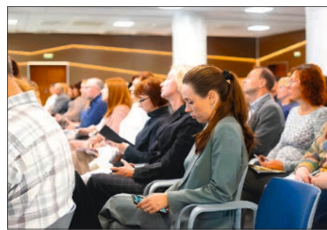
Круглый стол «Профессиональные компетенции специалистов по работе с утратой»