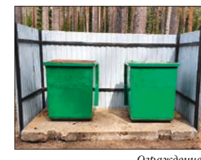
Ограждение контейнерных площадок