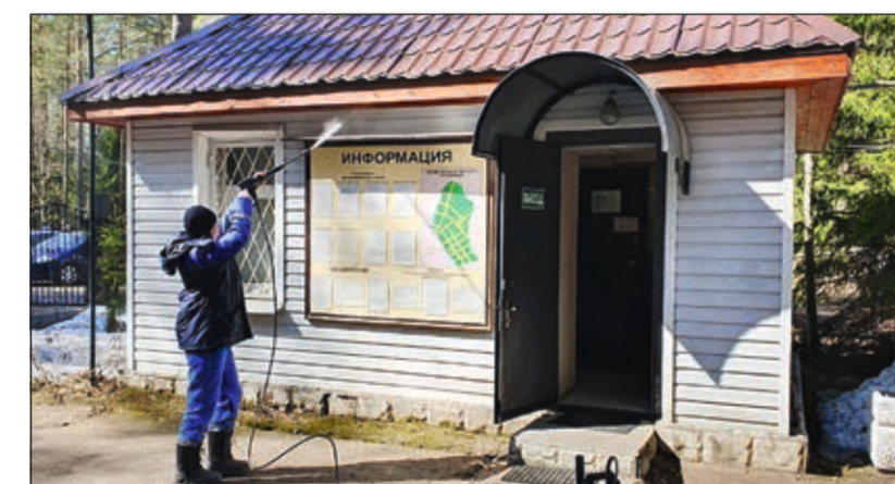
Помывка фасада административно-бытового комплекса