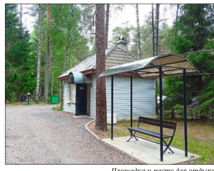
Площадка и место для отдыха рядом с административным зданием