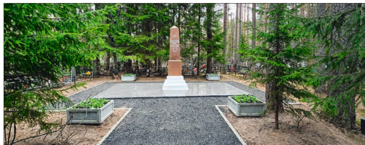
Уход за воинским братским захоронением

Зеленогорское кладбище находится на проспекте Ленина в городе Зеленогорске (до 1948 года – Терийоки). Датой его открытия считается 1917 год, но на нем сохранилась и более ранняя захоронения конца XIX – начала XX веков, когда эта территория входила в состав Российской империи и была частью Великого княжества Финляндского. Кладбище занимает площадь 20,5 га.