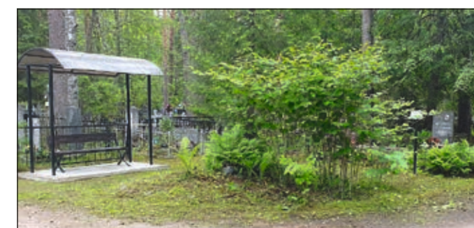
Обустройство зон отдыха для посетителей