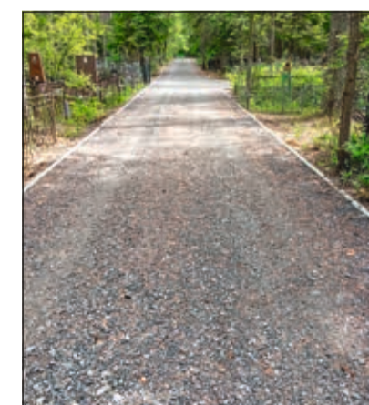
Обустройство асфальтовых и набивных дорожек