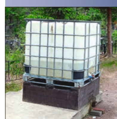
Места для забора воды посетителями