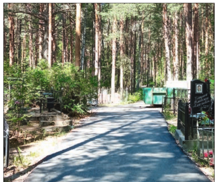
Обустройство межквартирных дорожек