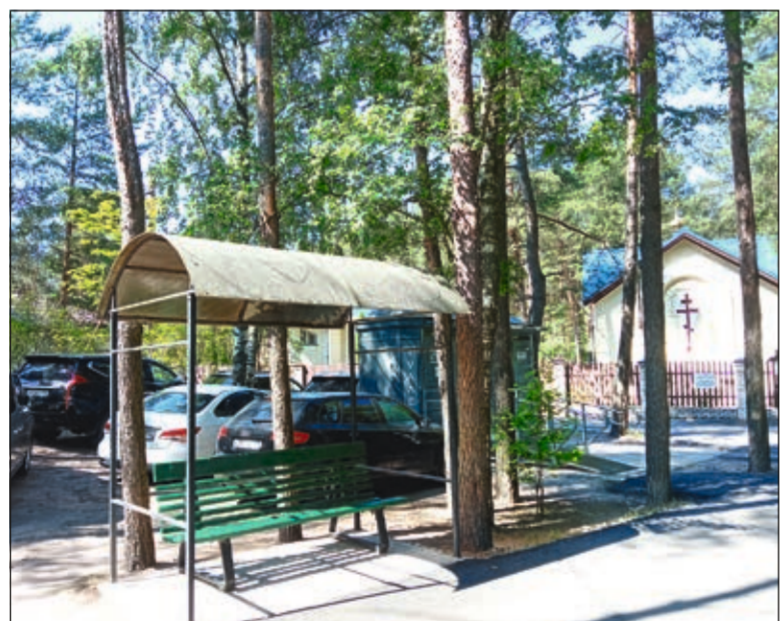
Благоустроенные места для отдыха посетителей