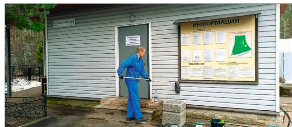
Помывка здания административно-бытового комплекса

Сайт Ассоциации предприятий похоронной отрасли Санкт-Петербурга и Северо-Запада