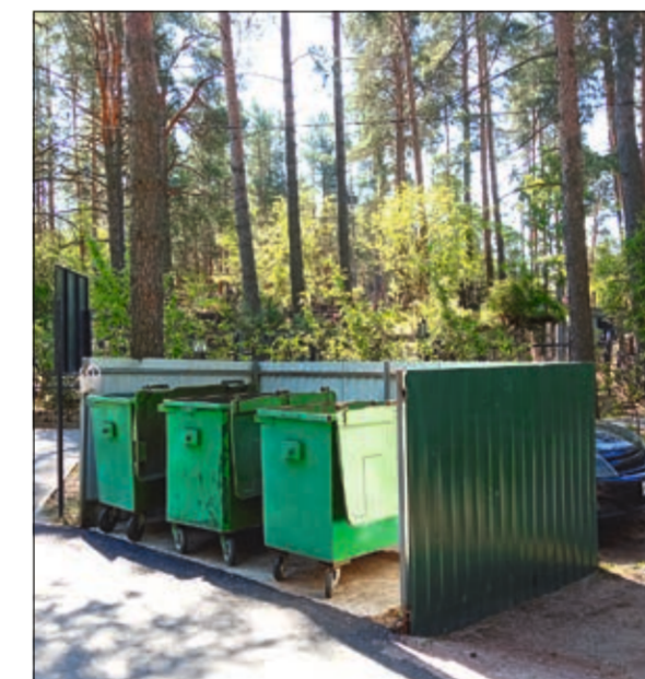
Площадки с мусорными контейнерами