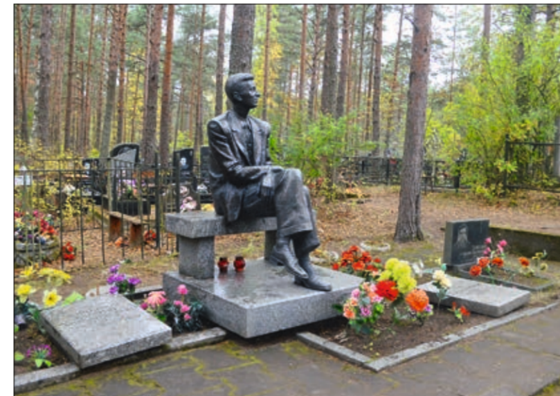
Захоронение М.М. Зощенко