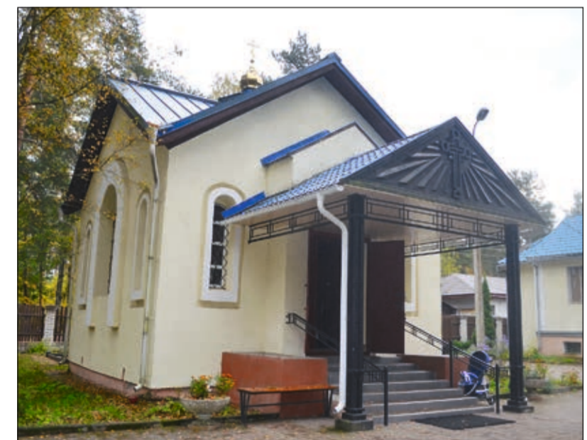
Часовня во имя св. Благоверного князя Александра Невского