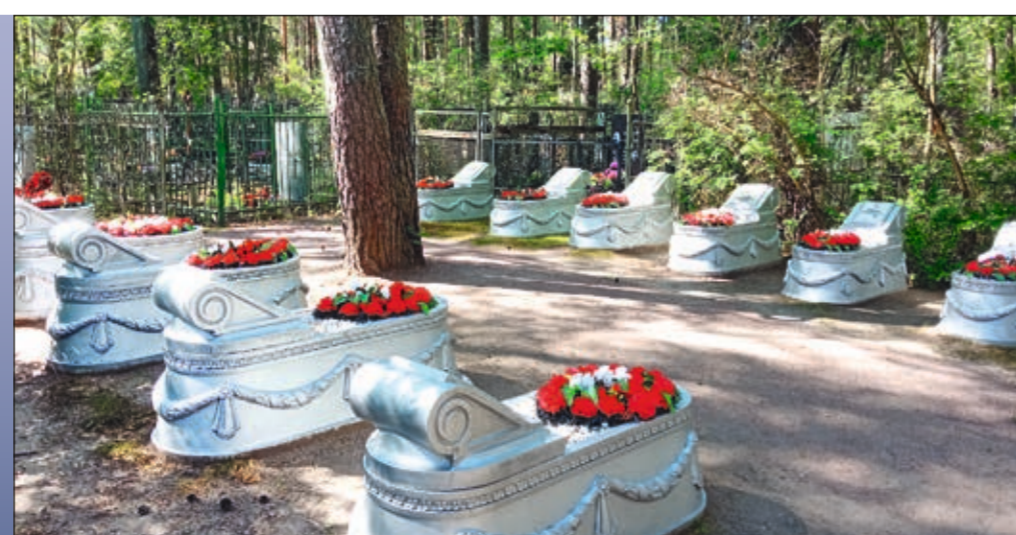
Очистка раковин на воинском братском захоронении