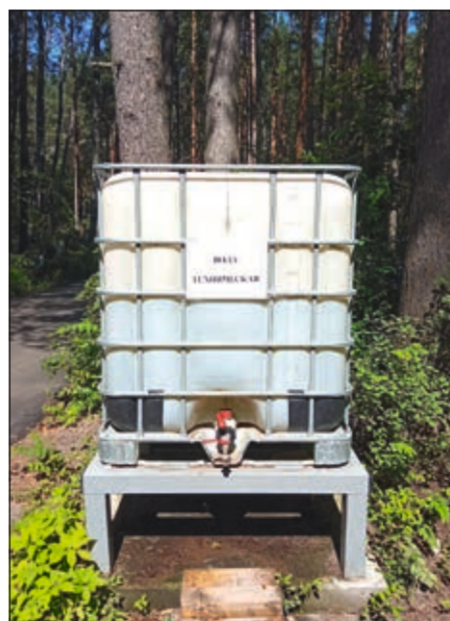
Место для забора воды посетителями