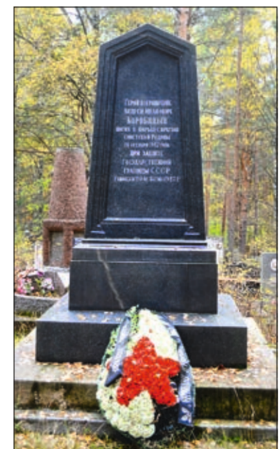
Захоронение А.И. Коробицына