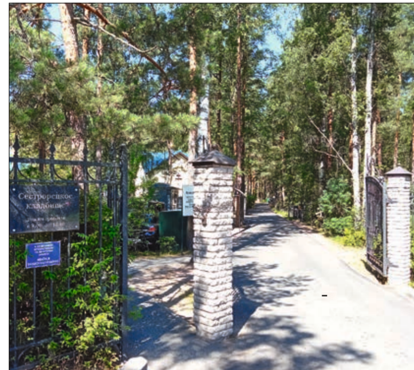
Главный вход на Сестрорецкое кладбище и информационный стенд

Сестрорецкое кладбище находится в Курортном районе Санкт-Петербурга и занимает площадь 17,8 га. Свою историю кладбище ведет со второй половины XIX века, после того, как в центре Сестрорецка большой пожар уничтожил Никольское кладбище. С 2014 года ООО «Собор», которое входит в Ассоциацию предприятий похоронной отрасли Санкт-Петербурга и Северо-Западного региона, производит все работы по содержанию, эксплуатации и благоустройству Сестрорецкого кладбища, а также оказывает на нем услуги по захоронению.