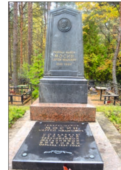
Захоронение С.И. Мосина