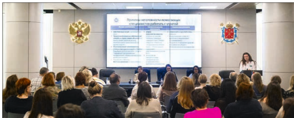
Участники круглого стола «Профессиональная компетентность помогающих специалистов при работе с утратой» в рамках проекта «Бережная поддержка»

Материал подготовлен Центром мемориальной культуры «ПАМЯТЬ БЕСКОНЕЧНА» www.pamyatbeskonechna.spb.ru