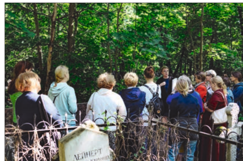
Экскурсия по Малоохтинскому старообрядческому кладбищу

До сих пор Малоохтинское старообрядческое кладбище является историческим некрополем, который полон легенд и загадок