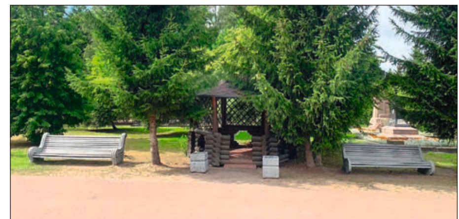
Благоустроенные места для отдыха посетителей