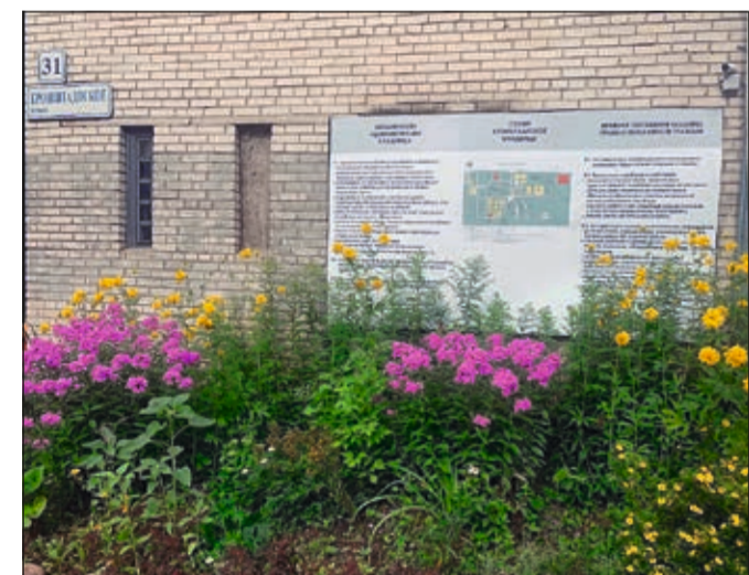
Новый информационный стенд