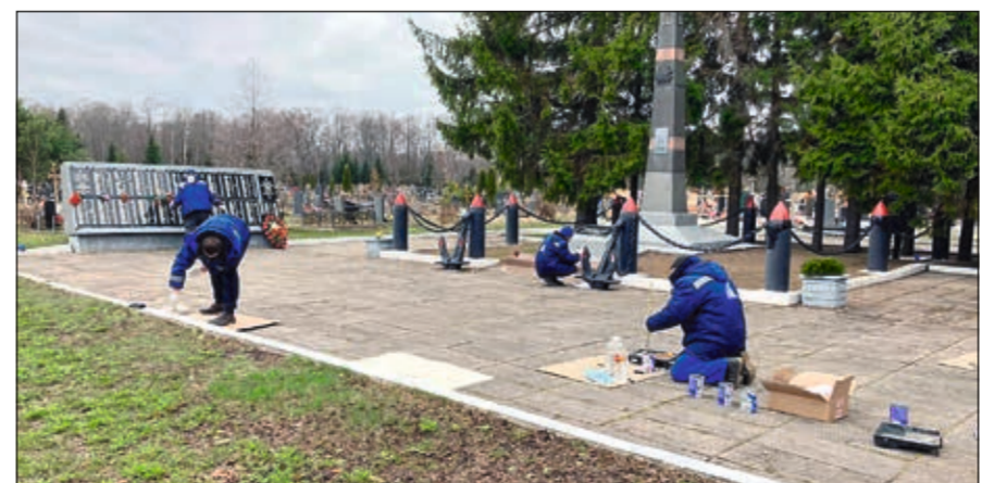
Подготовка территории воинского братского захоронения к 9 Мая