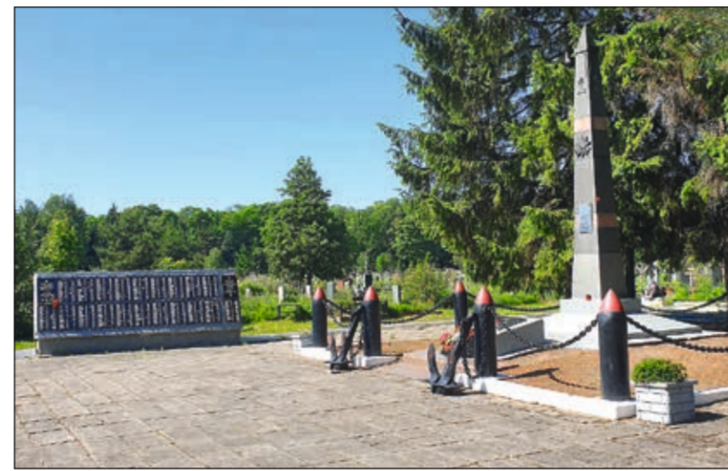
Воинские братские захоронения

К ронштадтское городское русское кладбище занимает площадь 40,74 га и расположено на острове Котлин по адресу: Кронштадтское шоссе, дом 31, лит. А. С 2014 года все работы по содержанию, эксплуатации и благоустройству кладбища, а также предоставление услуг по захоронению на нем осуществляет ООО «Похоронный дом», входящее в Ассоциацию предприятий похоронной отрасли Санкт-Петербурга и Северо-Западного региона.