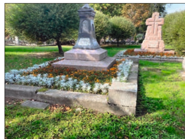
Уход за клумбами на исторических захоронениях