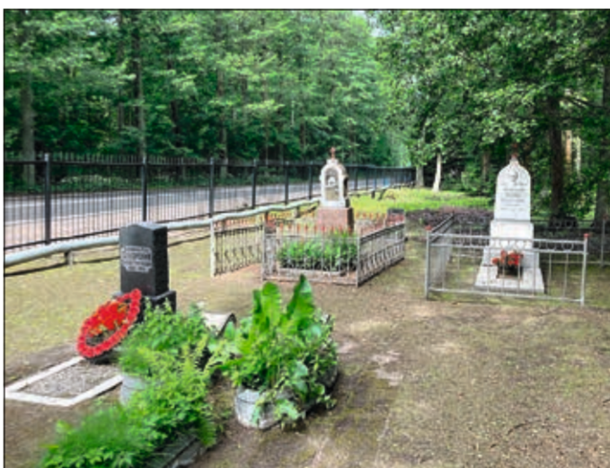
Уход за могилами Героев Советского Союза