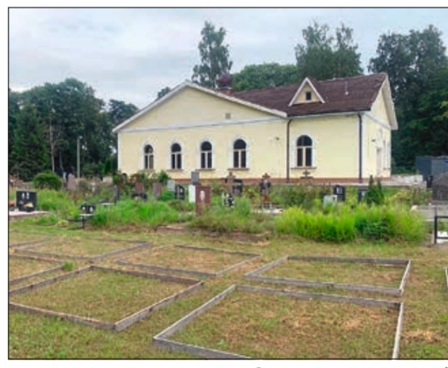
Зал прощальных панихид и подготовленные места для захоронений