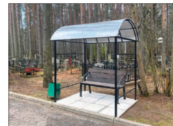
Благоустройство мест для отдыха посетителей