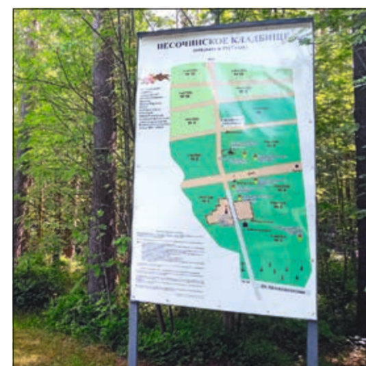
Новый информационный стенд