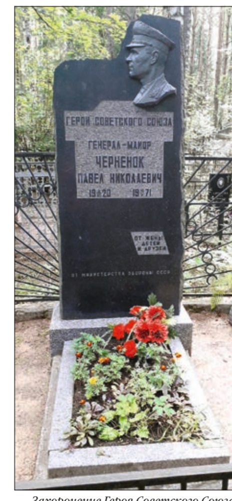
Захоронение Героя Советского Союза П.Н. Черненко