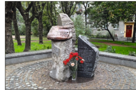
Наб. Чёрной речки, д. 20