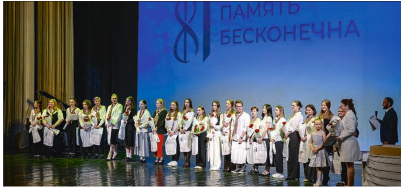
Праздничный концерт в ТК «Карнавал»

О том, что память — не набор фактов, а сила человеческих эмоций и отношений, напомнили петербуржцам на концерте «Память бесконечна», который прошел 13 июня в ТК «Карнавал».