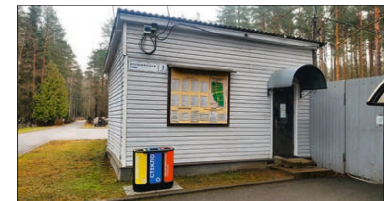
Баки для раздельного сбора мусора у здания администрации кладбища