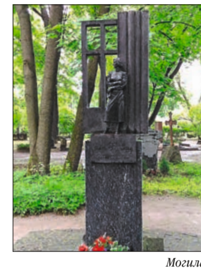
Могила на Литераторских мостках