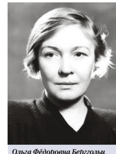
Ольга Фёдоровна Берггольц (16 мая 1910 года — 13 ноября 1975 года) — поэтесса, драматург, писательница и журналист. В блокадном Ленинграде работала в редакцию ленинградского радио. Берггольц каждый день выходила в эфир, читала свои стихи, ставшие символом стойкости и мужества ленинградцев. Ольгу Берггольц называли «музой блокадного Ленинграда» и его голосом. В осажденном городе она написала самые известные свои произведения: «Ленинградскую поэму», «Февральский дневник», «Ленинградскую тетрадь» и другие. Ольга Берггольц является автором памятных строк «Здесь лежат ленинградцы...», выбитых на гранитных плитах Пискаревского мемориального кладбища в 1960 году. Похоронена на Литераторских мостках Волковского кладбища. Памятник на могиле был открыт в мае 2005 года.