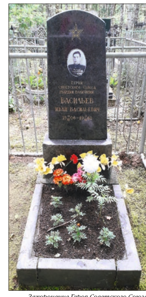
Захоронение Героя Советского Союза И.В. Васильева