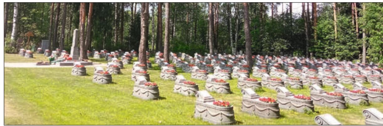
Воинское братское захоронение

ООО «Собор» производит ежемесячную уборку 1120 м 2 дорожек в зимнее время и 7520 м 2 – в летнее. В этом году планируется ремонт 250 м 2 набивной дорожки между участками №3 и 4. Летом ежемесячно выкашивается 1920 м 2 травы на территории воинских братских захоронений, а также на прилегающей к кладбищу территории. Ежегодно производится расчистка дренажных канав – вырубка поросли и покосы травы.