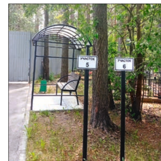
Новые указатели участков