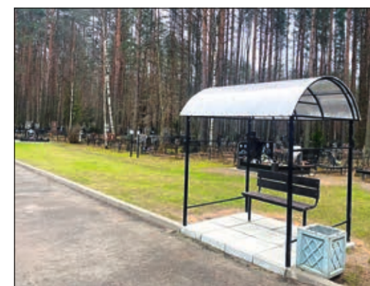
Покос травы у беседки для отдыха