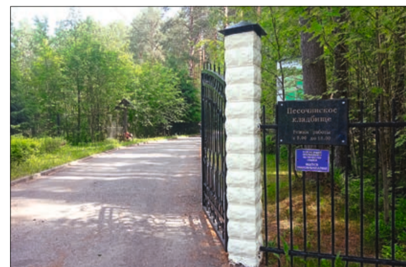
Благоустроенный вход на Песочинское кладбище