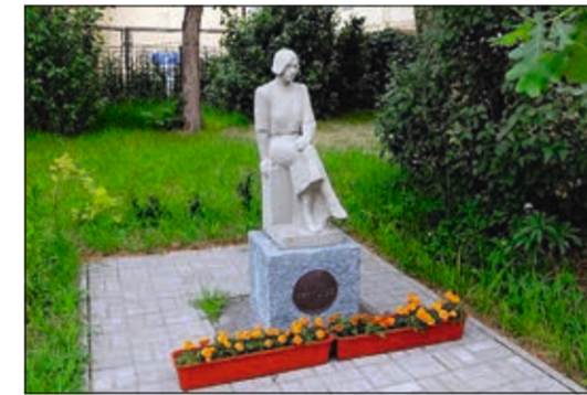
Гороховая ул., д. 57-а