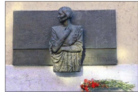
Ул. Рубинштейна, д. 7

Подготовил Павел ФЕДОТОВ