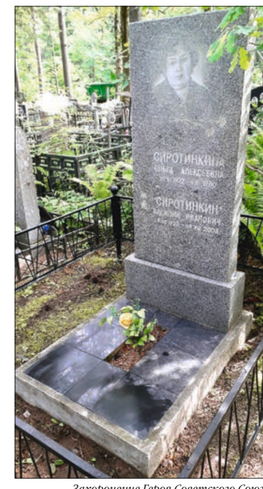
Захоронение Героя Советского Союза В.И. Сиротинкина