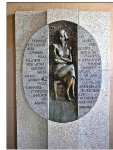
Дом радио, Итальянская ул., д. 27