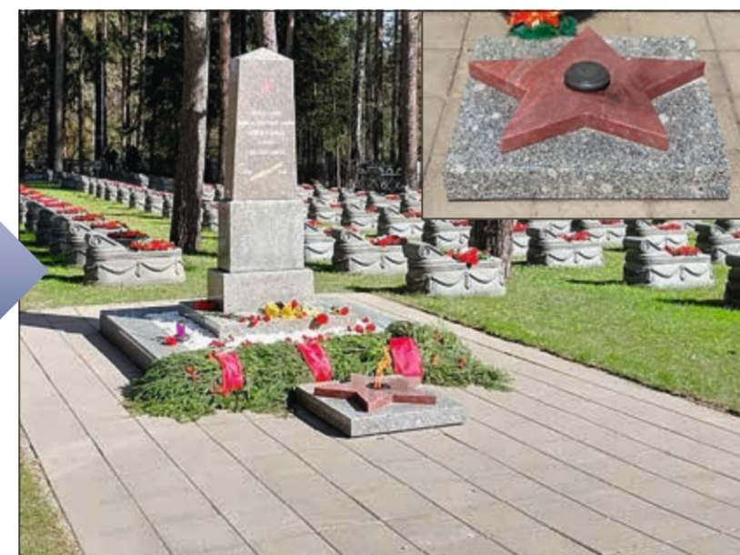
Благоустройство площадки у мемориала на воинском братском захоронении и установка гранитной звезды

станция Дибуны. В начале XX века в этой живописной дачной местности землю приобретали люди со средствами. Здесь находился кирпичный завод, работали школа, телефонная станция, телеграф, почтовое отделение, амбулаторный пункт.