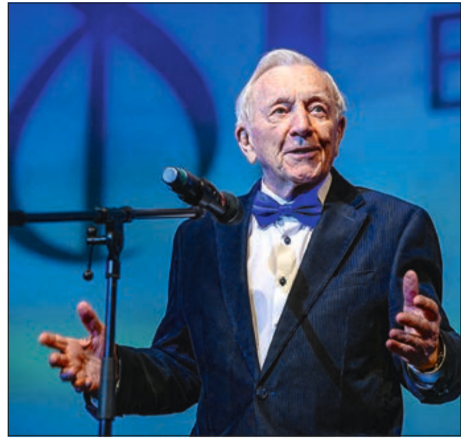
Народный артист России Георгий Шпиль